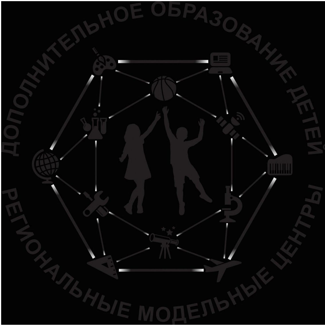
Схема 1. Регионального модельного центра Республики Калмыкия